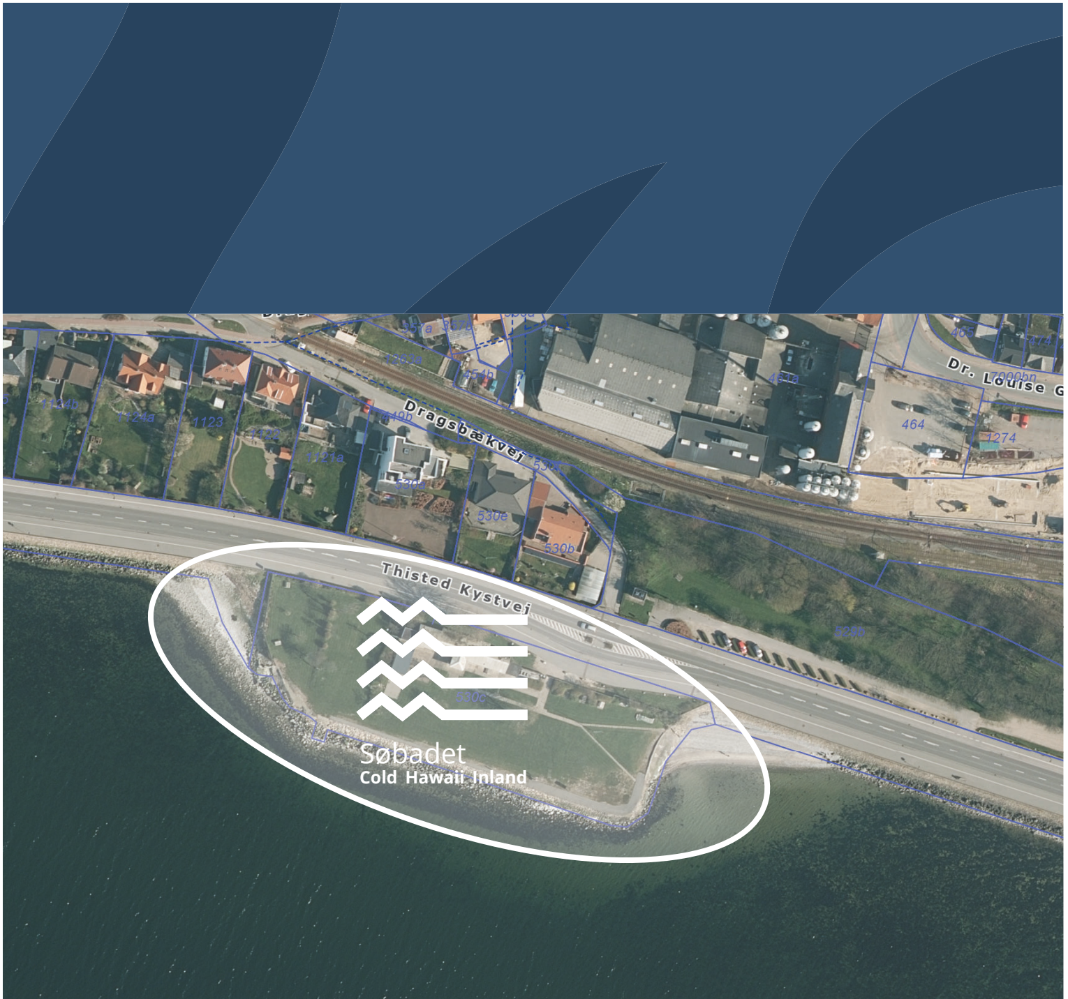
Thisted Midtby ved Limfjorden med hvid principiel markering af Søbadet ved Thisted Kystvej.